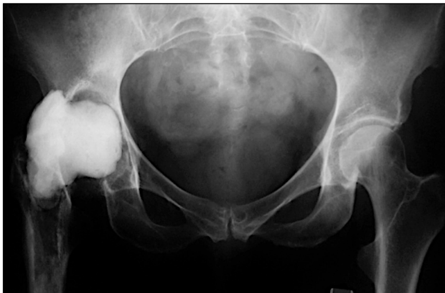
Εικόνα 3. Ακτινολογική εικόνα ισχίου με τοποθετημένο ορθοπαιδικό τσιμέντο εμπλουτισμένο με αντιβιοτικά.

Ιδιαίτερη σημασία έχει η επιλογή της κατάλληλης μεθόδου κατά περίπτωση ασθενούς, γιατί τότε οι πιθανότητες ριζικής εκρίζωσης της λοίμωξης ανέρχεται στο 80% περίπου. Στις περιπτώσεις που επιλέγεται παρηγορική θεραπεία, οι επιλογές είναι η αφαίρεση της προθέσεως χωρίς αντικατάσταση ή η μακρά, πιθανόν δια βίου κατασταλτική αντιμικροβιακή θεραπεία με ή χωρίς επέμβαση.